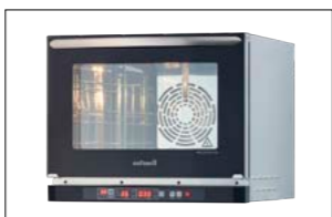
Mini Convection Oven