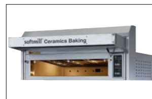
Euro Baker Oven