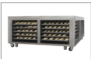
Rack at the lower part